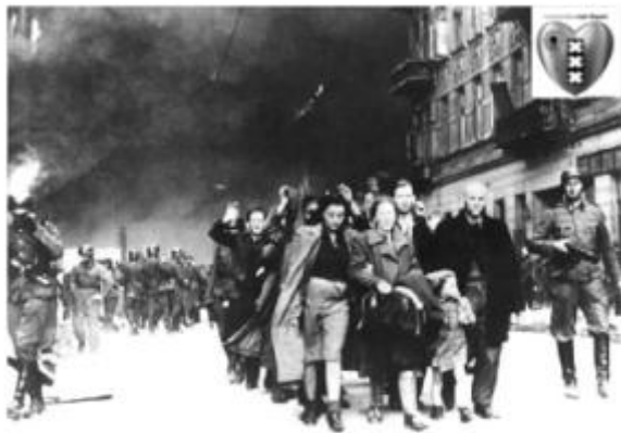
16 juli 2015 Grieken geven zich over aan de EU-Graai-Nazi's

Het VDA is een inclusief-patriottische partij die de bestaande machtspartijen en (geo)politiek daadwerkelijk ter discussie stelt, omdat de resultaten aan tonen dat het niet werkt. Het VDA wil een alternatief bieden voor een model dat overal verzuipt in zijn eigen contradicties. Het VDA is een sociaal-bewogen beweging van onder uit het