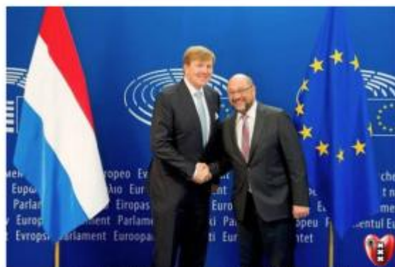
Doile Bilderberg pret en doffe ellende voor Volk. Graai King Willem en zijn Nep Hofnar Sociaal Democraat Martin Schulz liegen samen tegen het EU Parlement.

Ondertussen ontbreekt het de westerse democratieën, die na 1990 en vooral in Nederland na 1995 steeds meer een neobelligenrente VVD( Lees Misdaadgroep. Zie: Top 80 Crime Lijst VVD ) koers zijn gaan varen aan een stem die zich kan