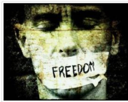
EU Pers Vrijheid voor het Volk

Wie het ook maar oneens is met de pretentieuze politieke projecten of netwerken